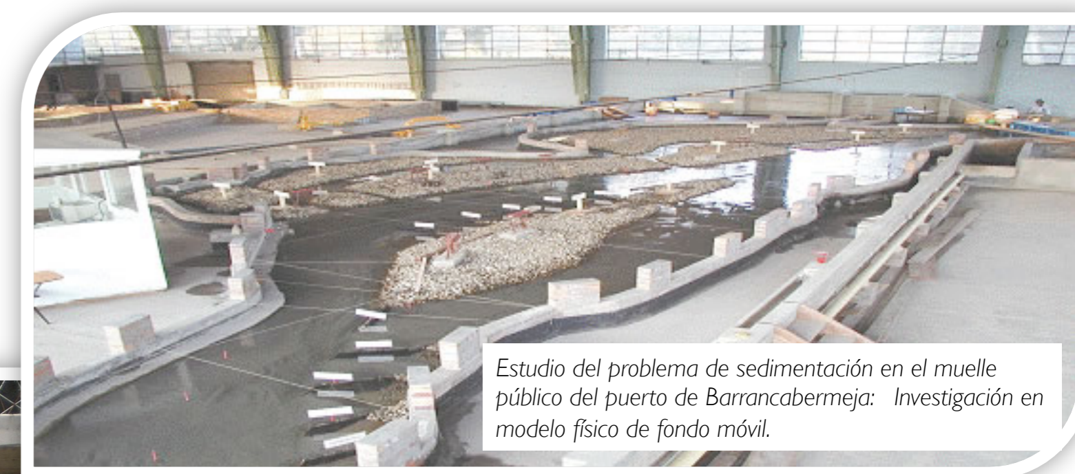
Estudio del problema de sedimentación en el muelle público del puerto de Barrancabermeja: Investigación en modelo físico de fondo móvil.