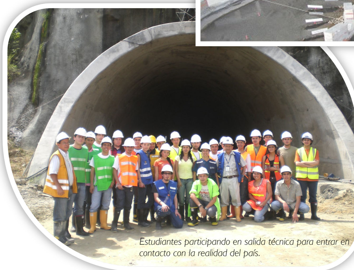
Estudiantes participando en salida técnica para entrar en contacto con la realidad del país.