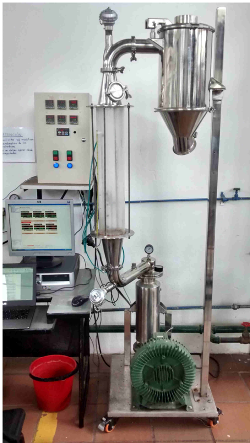
Imagen 1. Equipo de Fluidización, laboratorio de ingeniería química Universidad Nacional de Colombia